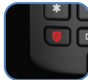
Tecla específica de bloqueo de llamadas