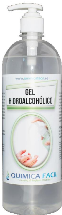
1000 ml con PUSH | 1000 ml con bomba