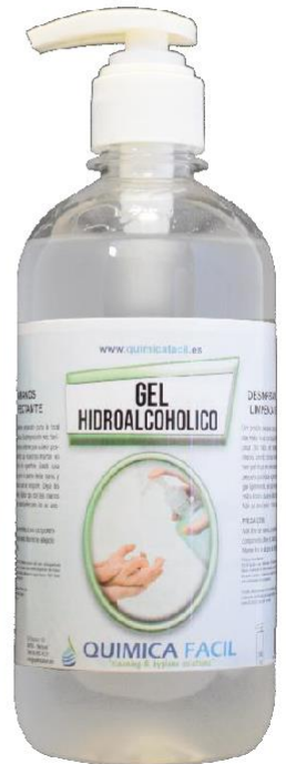
500 ml con PUSH | 500 ml con bomba