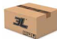
120 pares caja 120 pairs box